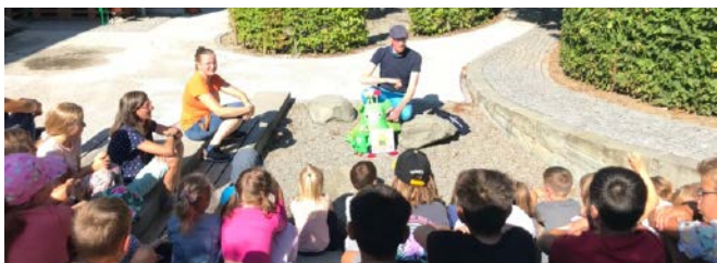
Wir lernen «das kleine Wir in der Schule» kennen.