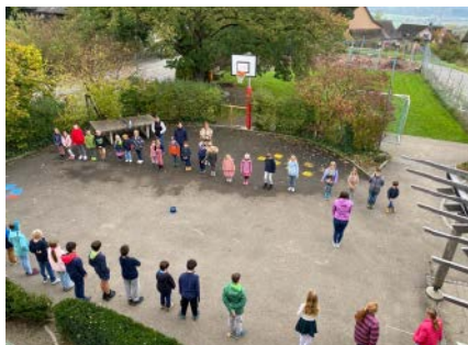
Welcher Abstand ist mir angenehm?